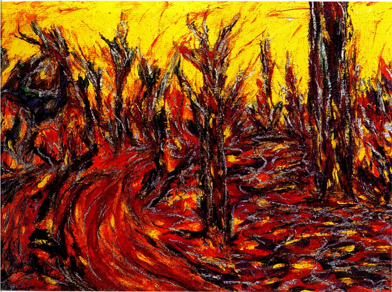
《阳光系列之四》李二平 作