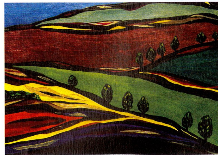
《阳光系列之六》李二平 作