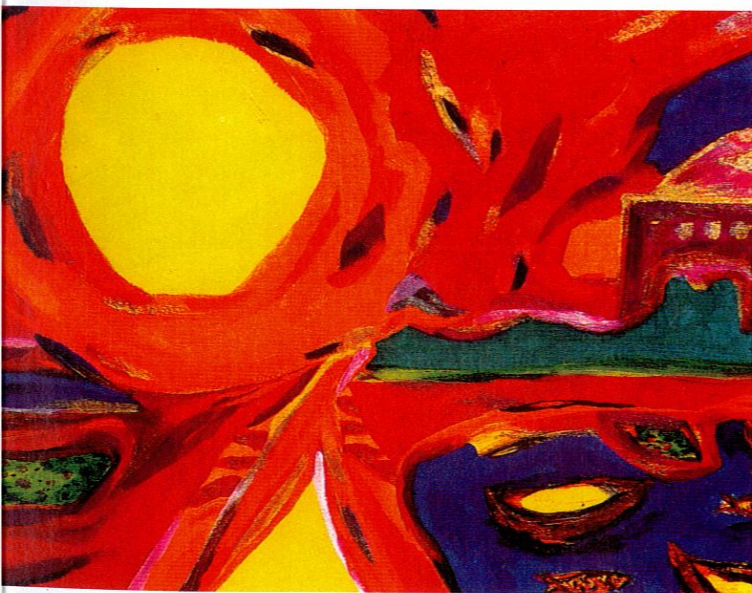
《阳光系列之一》李二平 作

太阳给予大地以生命、温暖和美丽。有了阳光给予植物的光合作用，才使大地所有植物保持郁郁葱葱的绿意，鲜花盛开，使整个世界色彩斑斓，洋溢美丽。有了阳光给予大地温暖，才使所有生命保持生机勃勃的状态。如果没有阳光普照大地，世界将一片漆黑，失去所有色彩和生命的活力。太阳对于大地的生命和美丽是如此重要。李二平在绘画中作了热烈的表现和讴歌。