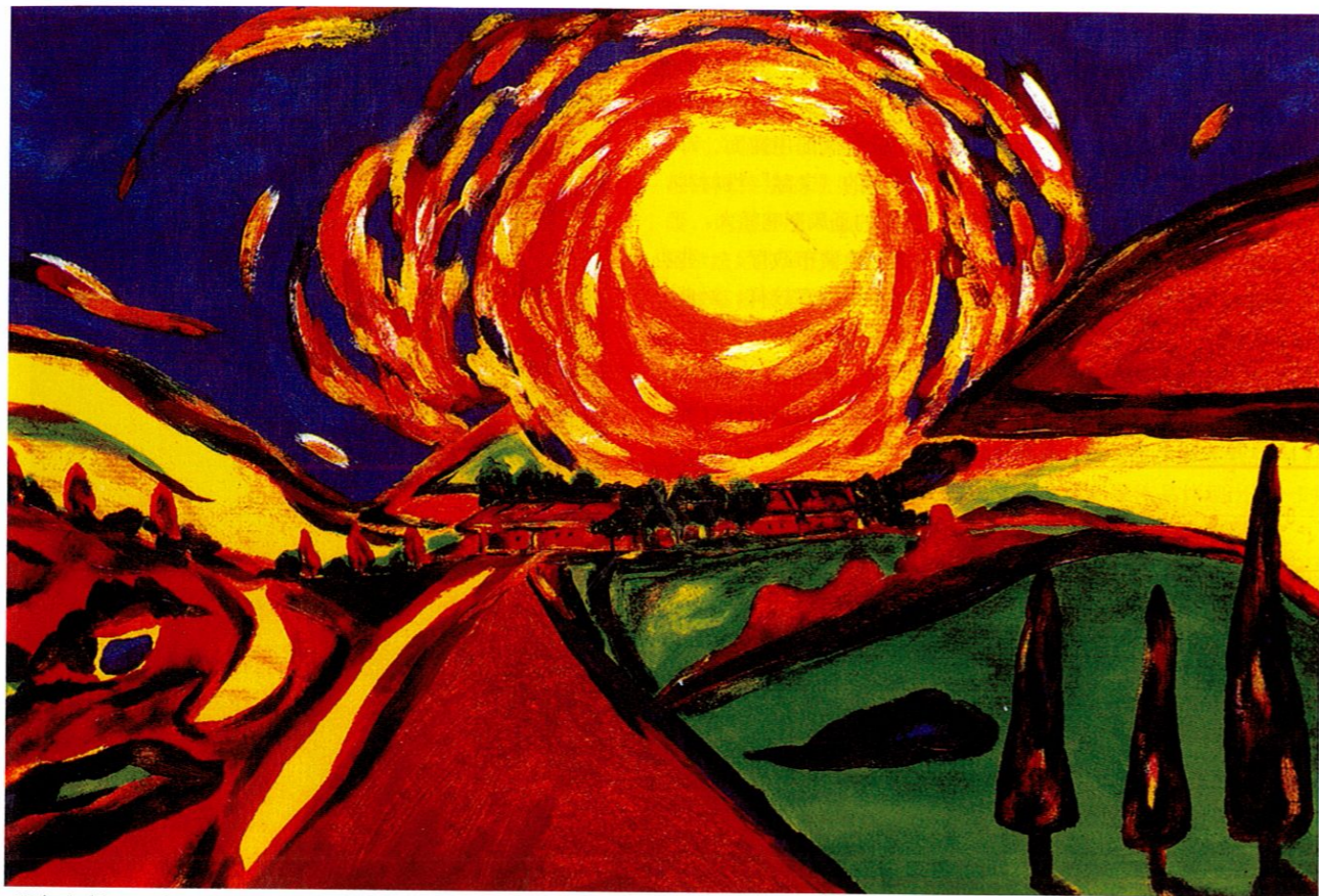
《阳光系列之二》李二平 作