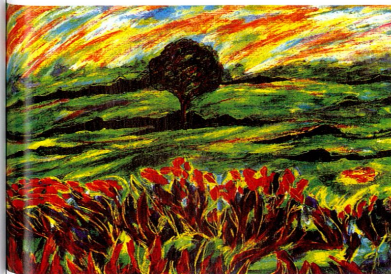
《阳光系列之五》李二平 作